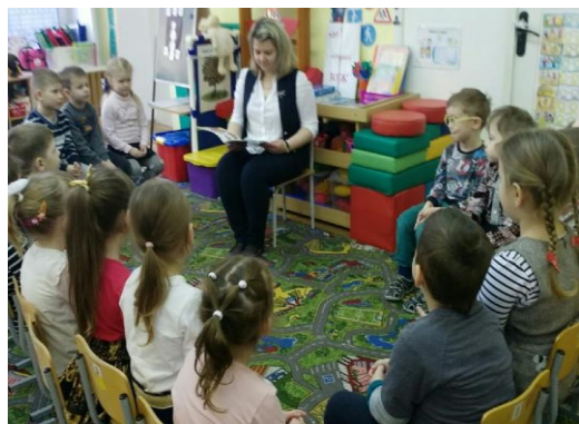
Слушание сказки «Мороз Иванович» В.Ф. Одоевского