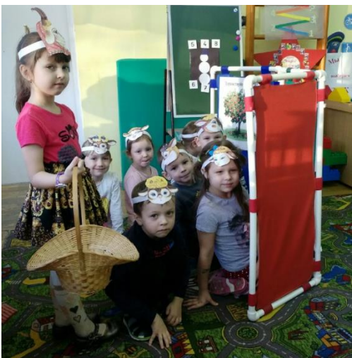
Актеры готовятся к показу сказки «Волк и семеро козлят»