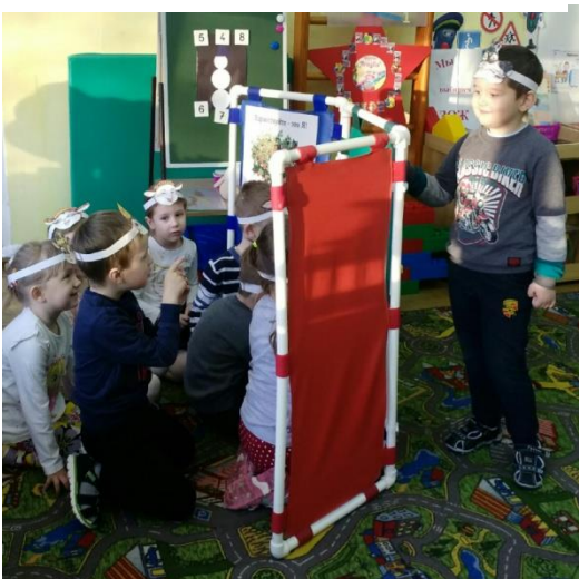
Инсценировка сказки «Волк и семеро козлят»

Чтение художественной литературы играет огромную роль для развития ребенка, особенно в старшем дошкольном возрасте. Главной задачей ознакомления с художественной литературой детей 5-6 лет является воспитание интереса и любви к книге, стремление к общению с ней, умению слушать и понимать художественный текст.